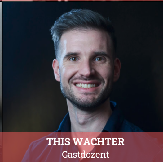
THIS WACHTER Gastdozent